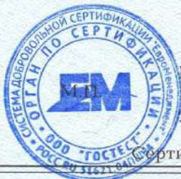
Схема сертификации 3с